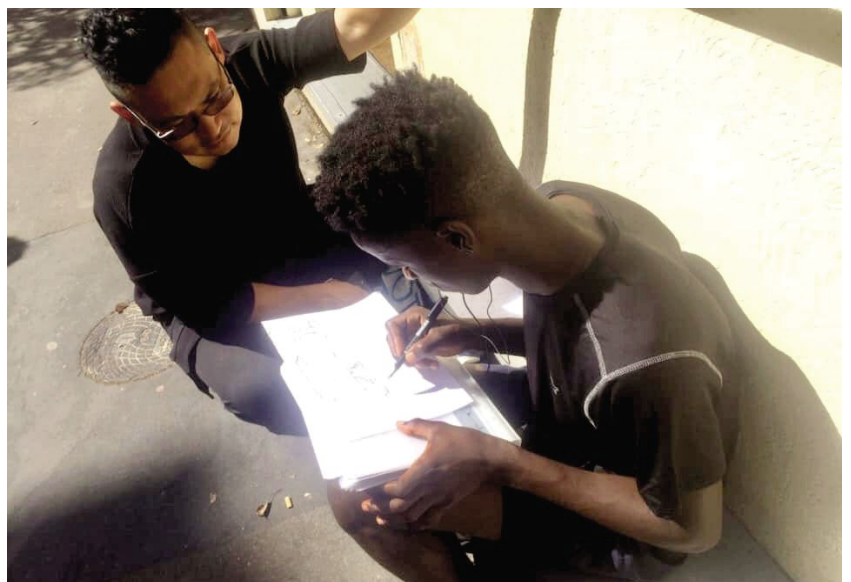
《家園》藝術家在法國巴黎街上找尋並邀請有難民身份的遷徙者繪製出逃難前原居處的街道圖,並用紅線畫出“家園的輪廓(地籍格)”或“家園的界線(地籍線)”,及後藝術家向難民們購買這張「土地地圖」和所有權。(圖片由受訪者提供)