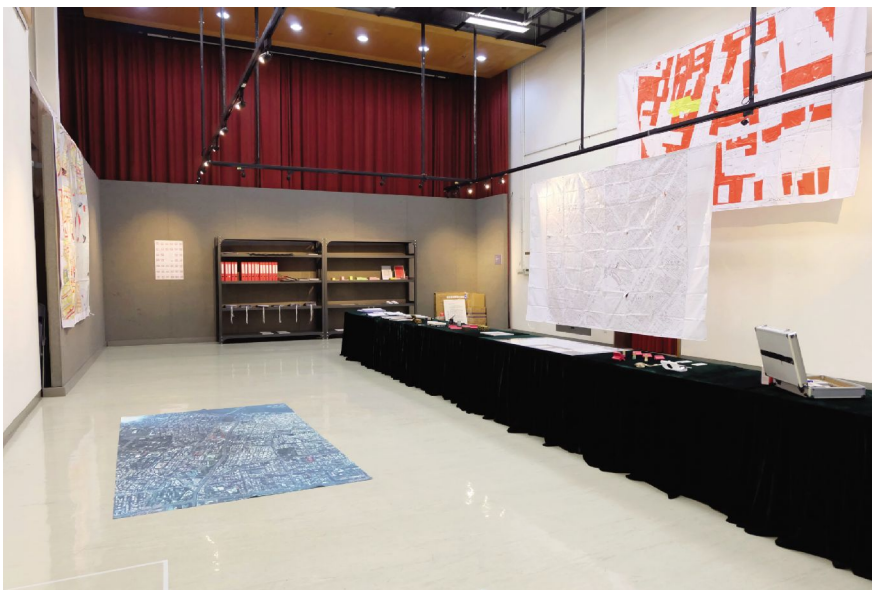
展品包括《開放檔案的權限》、《機密資料出現了》、《生活契約》，以及4張畫作，共7件/組展品。

蔡國傑表示，《半田計劃》到美國、德國、意大利、法國等不同國家進行藝術實踐，接觸過因戰爭痛失家園的難民，亦有貧富差距懸殊的紐約市民，各人心中對“空間”的定義不一，“有人花30年青春賺取一個住處，亦有人與生俱來就獲分配房屋，透過‘間性空間’的展示，打破人們對空間的原有定義，再反問：自己心中如何定義‘空間’？”蔡國傑認為，雖然這類概念藝術展覽在澳門不常見，但空間概念的認知有其必要性，“有次我和弟弟去香港旅遊，他只想到景點打卡，途中或是睡覺或是對經過的景象事物漠不關心，難道旅遊只為了打