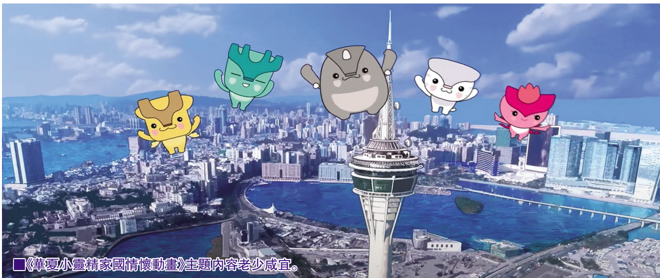
■《華夏小靈精家國情懷動畫》主題內容老少咸宜。