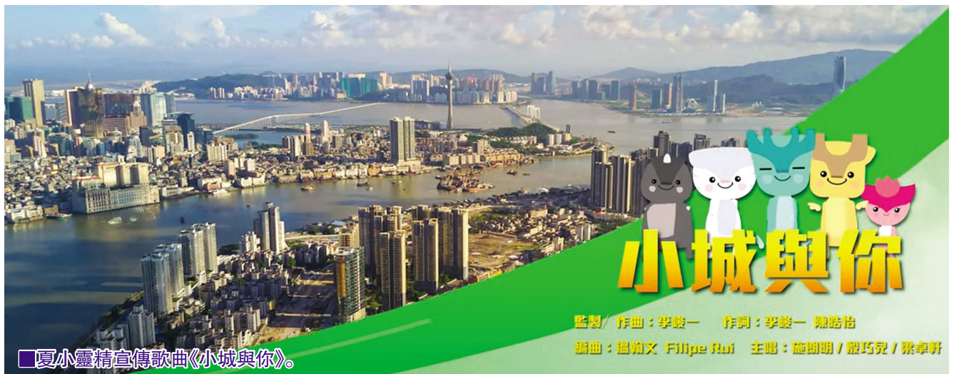
■華夏小靈精宣傳歌曲《小城與你》。

為加深兒童對小靈精的印象，並更好地瞭解《叢書》內容，基金會推出以《叢書》為藍本的2D動畫，讓讀者們跟隨小靈精展開精彩的歷史文化之旅。《華夏小靈精家國情懷動畫》共5輯，故事中小靈精介紹祖國和澳門，坐時光機重回1949年中華人民共和國成立的開國大典、1987年中葡草簽關於澳門問題的《聯合聲明》現場…故事中小靈精各