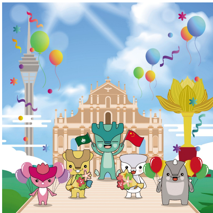
■華夏小靈精(由左至右)分別為“火火”、“阿麟”、“阿活”、“小白”和“大嚙”。

為促進市民對中華及本土歷史文化的認識，澳門基金會及其歷史文化工作委員會以“華夏小靈精”的親善形象，推出宣傳歌曲《小城與你》，歌曲MV中，5位主角小靈精暢遊澳門中葡文化交融的世遺景點，品