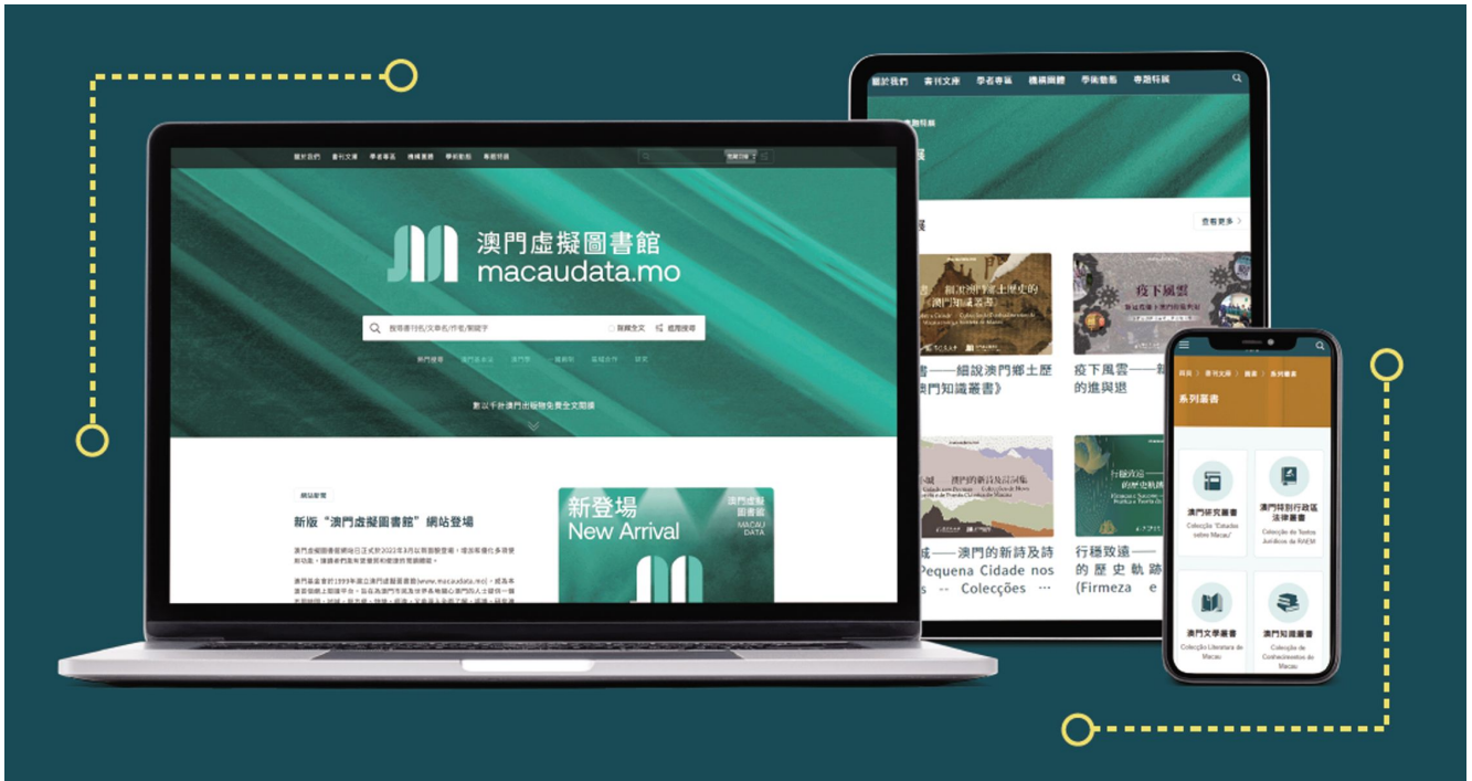
■澳門虛擬圖書館持續推進線上閱讀平台的高質量發展，促進社會閱讀風氣。

期刊量亦增至 888 冊，更整合了各學科的經典文獻與最新成果，同時提供全文閱讀及深度檢索功能。王國強表示，新版平台將本地學術出版進行分類，除了澳基會品牌的“系列叢書”外，“期刊”和“論文”欄目令人耳目一新，他稱，“澳門學術雜誌或期刊的存放較零散，一般圖書館難以統一查找全部期數，樂見澳門虛擬圖書館能完整地呈現具代表性的澳門圖書期刊，亦讓讀者掌握最完整的本地雜誌和出版資源。”